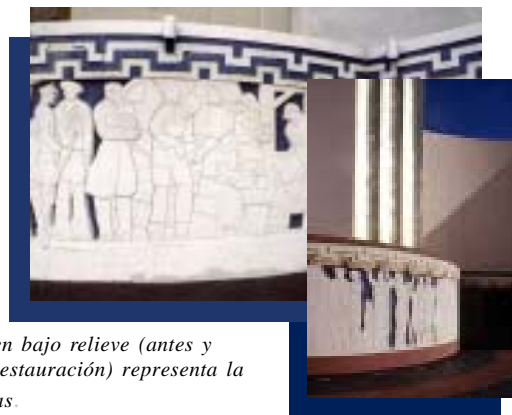
Torre labrada en bajo relieve (antes y después de la restauración) representa la historia de Texas.

(Patrocinado por el gobierno de la ciudad de Dallas y la Administración del Parque de la Feria, una División del Departamento de Parques y Recreación)